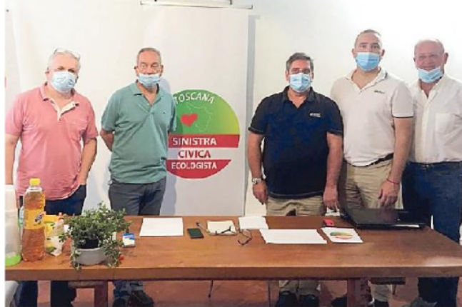
I partecipanti alla conferenza stampa di presentazione della lista